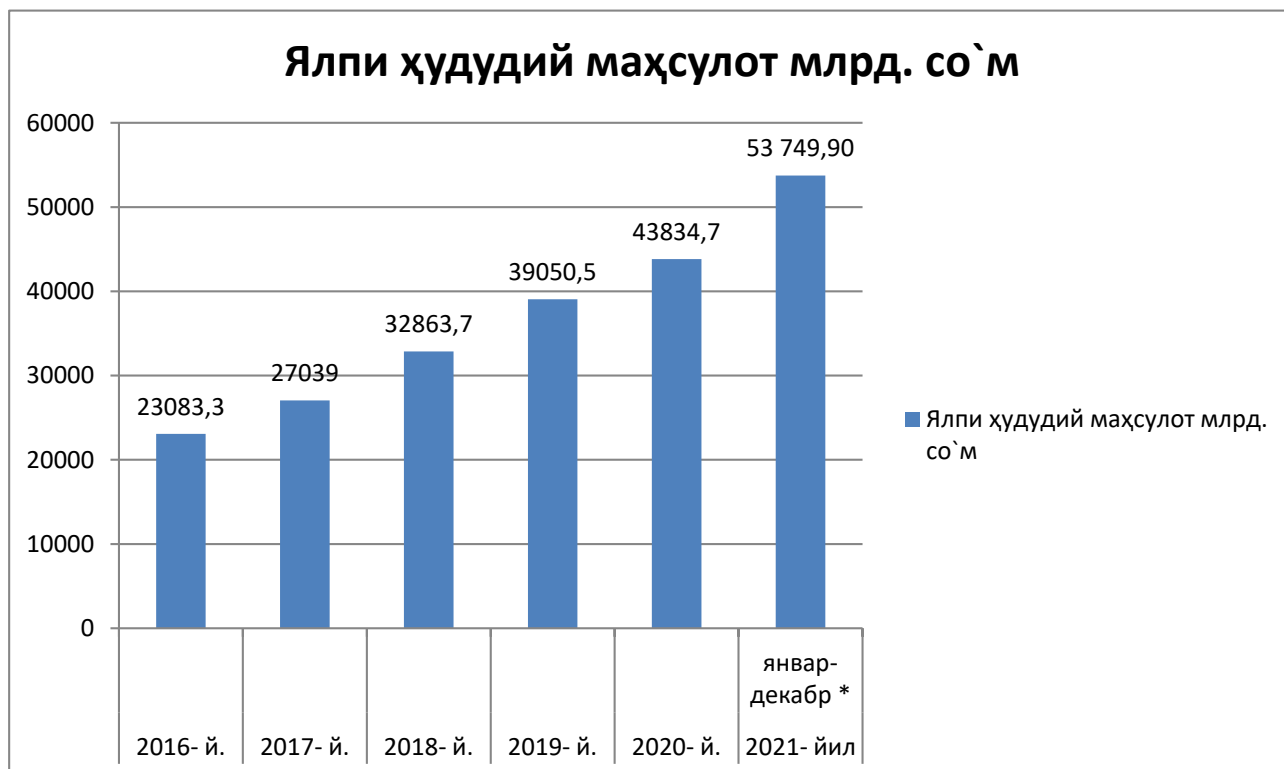
2-расм. 2016-2021 йиллар мобайнида Самарқанд вилоятинг ялпи ҳудудий маҳсулотининг ўсиш динамикаси.

Ялпи ҳудудий маҳсулот кўпайишига, энг аввало саноат маҳсулотлари кўпайиш кўрсаткичи ижобий таъсир қилувчи омил бўлиб ҳисобланади. таҳлил қилинаётган давр мобайнида ялпи ҳудудий маҳсулот, 2,32 марта кўпайган бўлса, саноат маҳсулоти 3,06 марта кўпайган. Демак бундан шундай хулоса қилиш мумкинки, саноат маҳсулоти таҳлил қилинаётган давр мобайнида ялпи ҳудудий маҳсулотга қараганда 1,32 марта юқорироқ ўсиш тенденциясига эга бўлган.