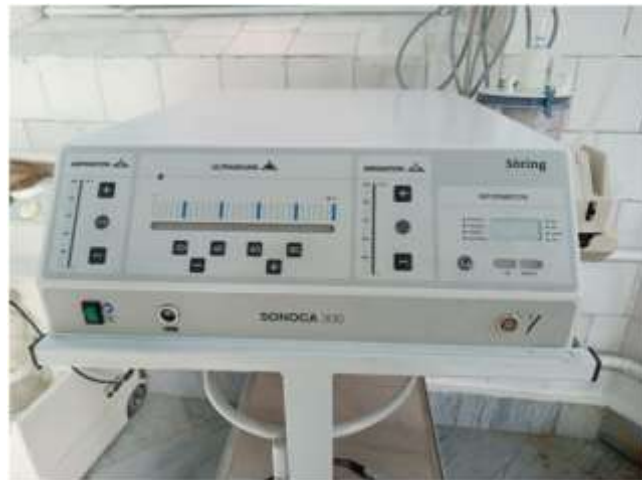
Рис. 1. Кавитационный ультразвуковой диссектор аспиратор – SONOCA 300 (фирма Söring)

Учитывая эти обстоятельства с 2020 года радикальные операции выполнялись при помощи кавитационного ультразвукового диссектора аспиратора SONOCA 300 (рис. 1).