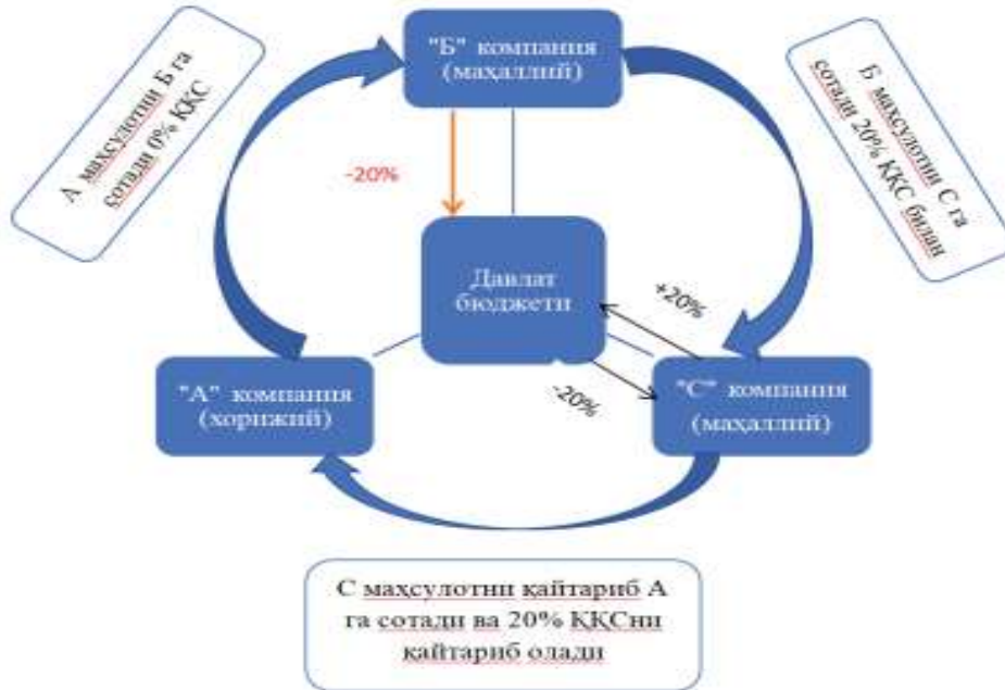
5-рasm. ҚҚС карусел фирибгарлиги чизмаси 4

muammolardan biri hisoblanadi. Bunda davlatlararo QQS solig'ining to'lanmasligidan foydalangan holda ayrim korxonalar davlatdan davlat budjetiga to'lamasdan turib QQSni talab qilib olishadi va bu orqali ular pul ishlashadi. Ularning ishlash mexanizmi 5-rasmda aks ettirilgan.