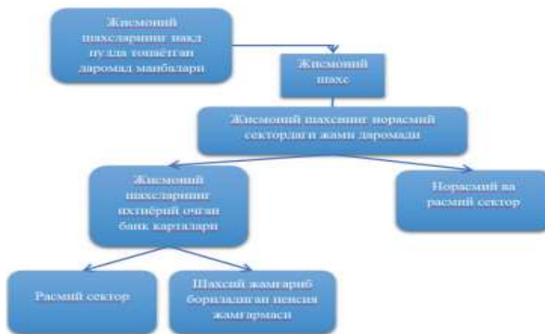
3-расм. Норасмий секторда қисман ёки тўлиқ банд бўлган жисмоний шахсларнинг даромадларини расмий секторга ўтказиш механизми

Sotuv hajmining ayrim qismi yashirin iqtisodiyotda amalga oshirilayotgan faoliyat turlaridan biri bu vending mashinalardir. 2017 yildan boshlab Italiyada, 2019 yildan boshlab esa Ven griyada, mamlakatda faoliyat yuritayotgan vending mashinalarini o'rnatadigan tadbirkorlik subyektlarining barchasi o'zlarining vending mashinalarini soliq idoralariga onlayn tarzda ulashlari lozim, bunda ushbu mashinalar sotuv hajmining barchasi soliq idoralarining bazasida qayd etiladi va bu soliq bazasi ning aniq hisoblanishiga sabab bo'ladi.