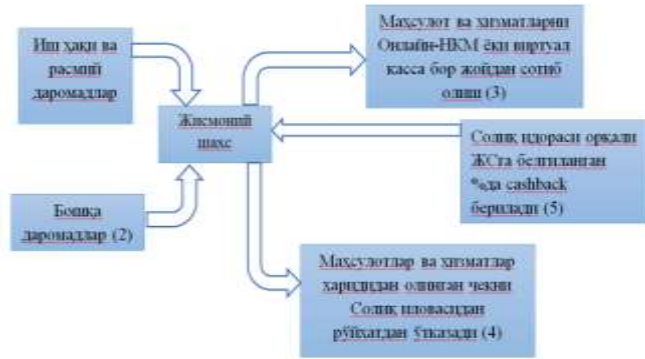
1-расм. Яширин иқтисодиётни аҳоли даромадлари ва харajatлари орқали аниқлаш механизми 1